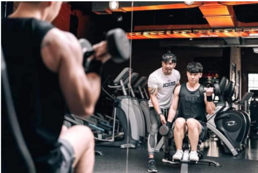
เทรนเนอร์มืออาชีพ จากสถาบันการศึกษาที่ได้รับการรับรอง

สร้างขึ้นด้วย Passion ของ Founder 3 คน ที่อยากให้คุณพักขาที่มีสถานที่ออกกำลังกายสนุกๆ อุปกรณ์ เครื่องเล่นที่ทันสมัย มีคุณภาพ รวมถึงการสร้างบรรยากาศและสังคมดีๆ เป็นที่ๆทุกคนรู้สึกสบายใจที่จะมา ออกกำลังกายและมาได้แม้ในวันที่ไม่อยากจะออกกำลังกาย สถานที่ให้บริการออกกำลังกายแบบครบวงจร ให้บริการเครื่องเล่นเวทเทรนนิ่ง, คาร์ดิโอและการออกกำลังกายแบบกลุ่มและส่วนตัว รวมไปถึงให้บริการ อาหารและเครื่องดื่มสุขภาพ