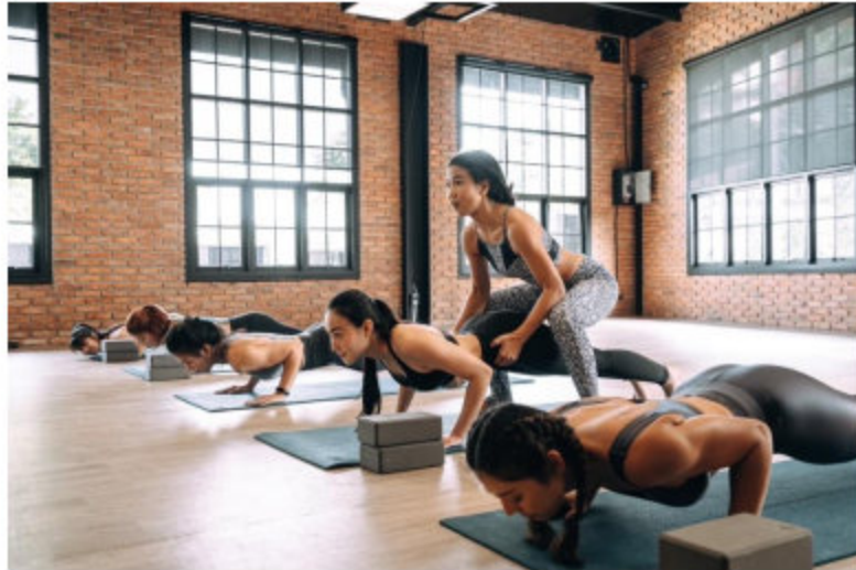
การออกกำลังกายคิลิปัท