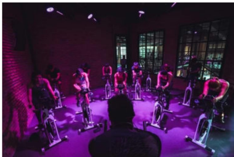
การปั่นจักรยาน (Spin Bike)