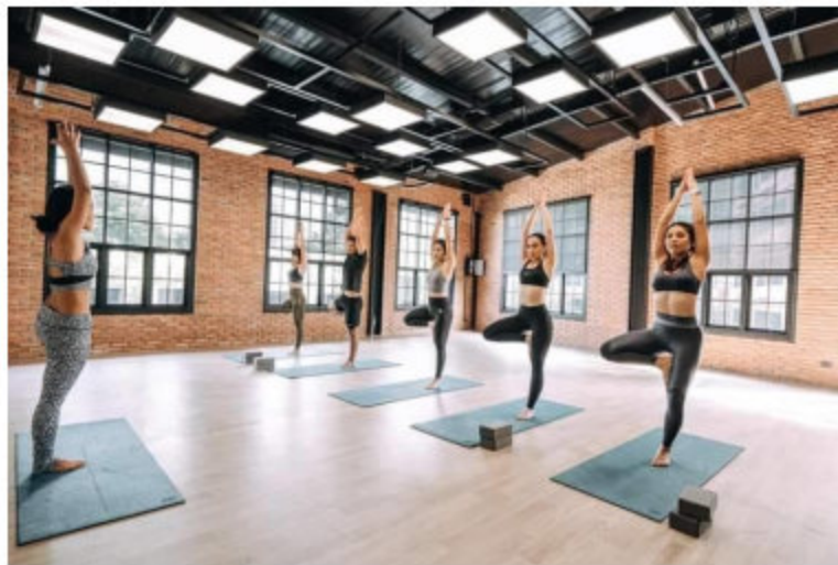
การโยคะ (Yoga, Body Stretching)